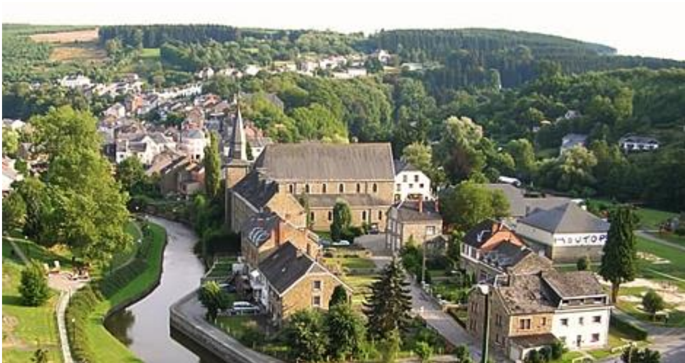
Houffalize ligger inbäddad i floden Ourthes dalgång.