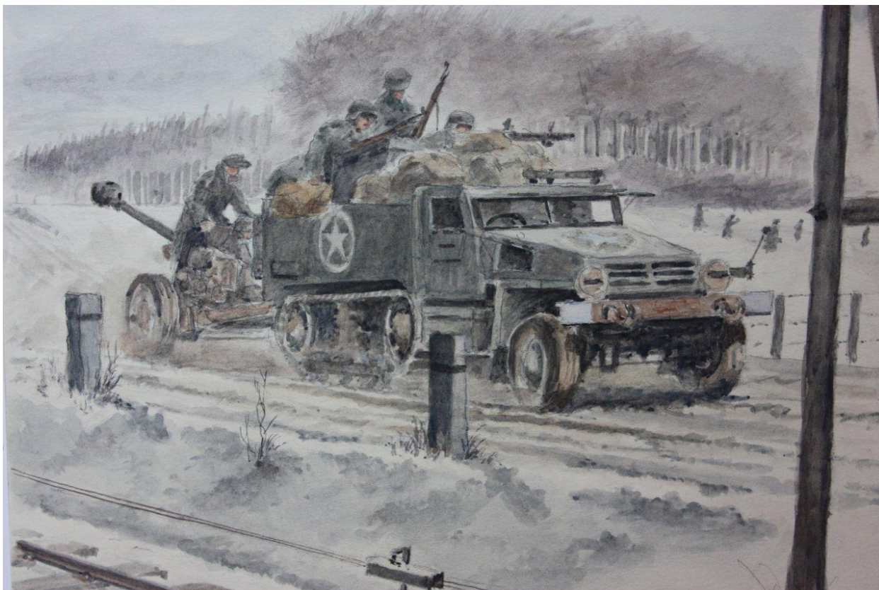
Målning av Horst Helmus, tysk soldat i Ardenneroffensiven.