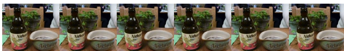
Vince Speranzas öl Airborne dricks traditionsenligt ur en hjälm i porslin.