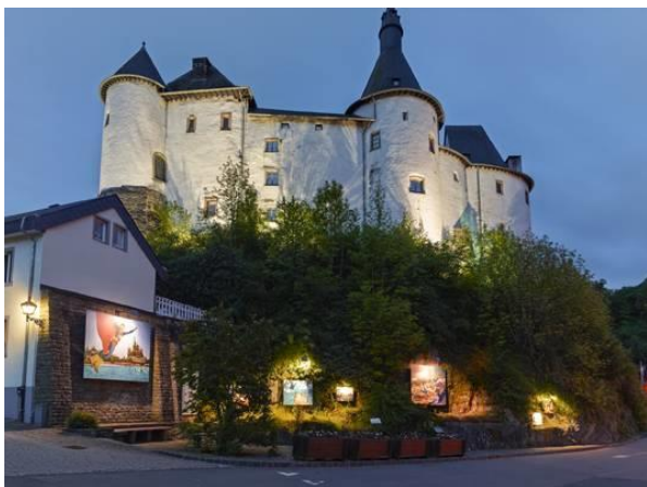
Slottet i Clervaux.