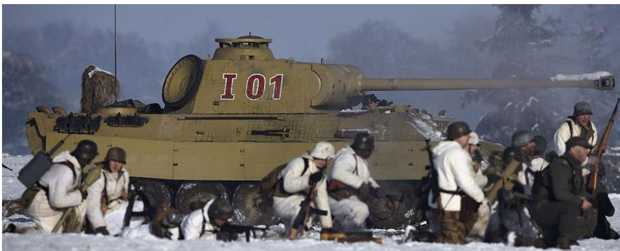
Reenactment i Ardennerna.