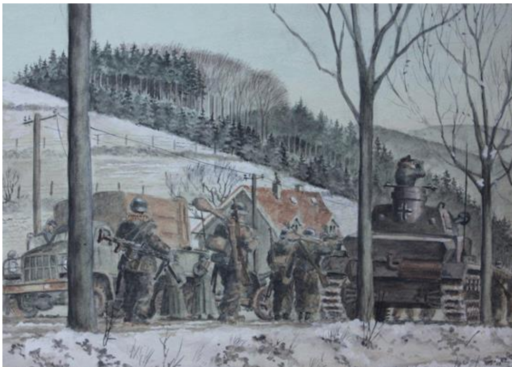
Målning av Horst Helmus, tysk soldat i Ardenneroffensiven.