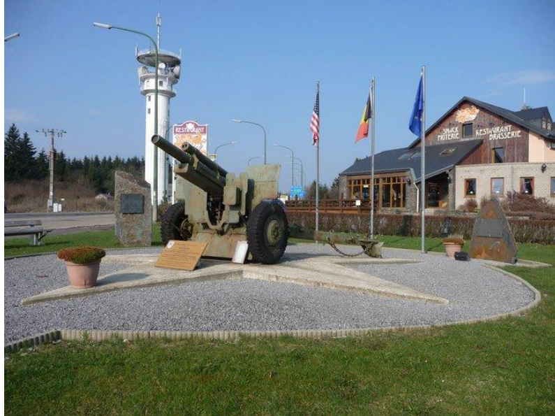
Baraque de Fraiture.