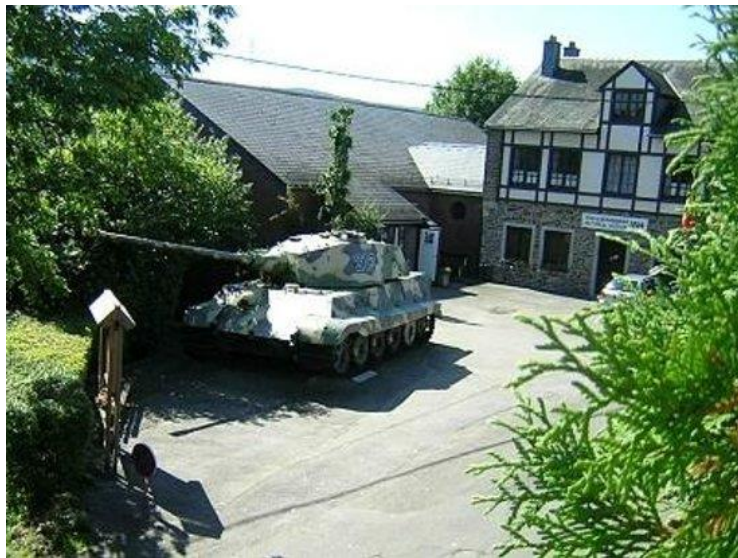
La Gleize med Königstigern.