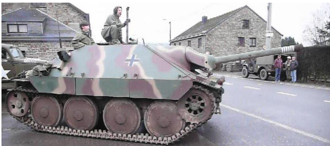
Jagdpanzer Hetzer i Manhay.

Kl 17.00 Buss till Hotel Vayamundo i Houffalize, där vi inkvarteras för två nätter.